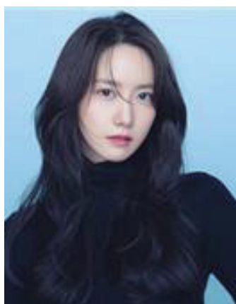
少女时代成员 林允儿