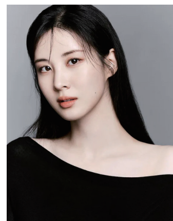
少女时代成员 徐贤